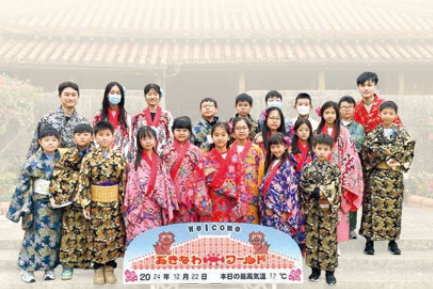
同學穿上沖繩的傳統琉球服飾，留下美好的回憶。

同學亦到訪了當地特色市場，認識沖繩人的日常生活狀況。為了令同學們能從不同層面學習，本次的考察之旅融合了更多的體驗活動，讓同學一起「動動手」，親身體驗各種不同文化。