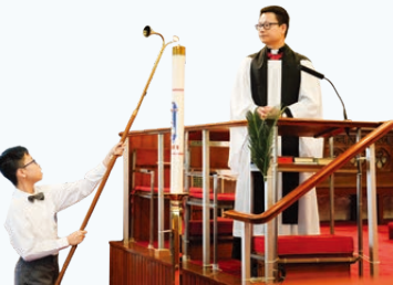
同學們在崇拜中擔任不同侍奉崗位。