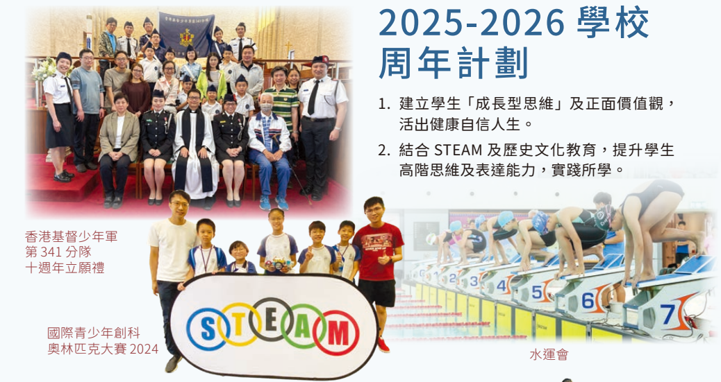
香港基督少年軍 第341分隊 十週年立願禮