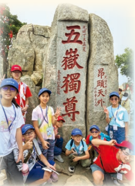
本校舉辦山東省文學及歷史考察團，同學不怕艱辛，登上五嶽之首——泰山。

資訊素養相關的學與教活動培養學生有效及符合道德地運用資訊及創新科技。中文科舉辦「文學及文化考察團」，透過考察認識當地歷史、文化、文學與藝術，學習相關的文學作品。透過各科組活動、歷史教學、內地學習團等，加強學生對法治和國情的認識，明白維護國家安全的重要性。