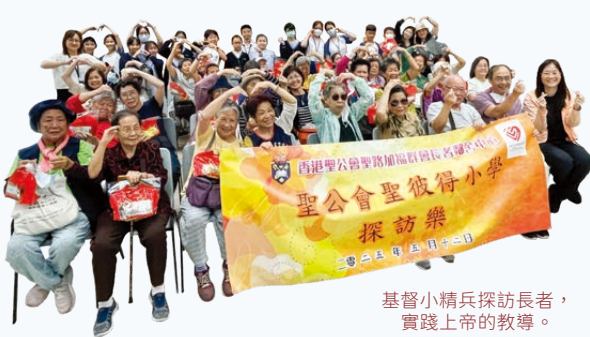
基督小精兵探訪長者， 實踐上帝的教導。