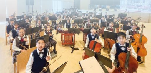
本校創設具規模的中樂團，參加不少學界比賽及奪得殊榮！

學藝發展組致力營造校園藝術氛圍，開設「藝術學會」、「美化校園計劃」、「中西洋畫」等課程，讓學生有更多機會接觸不同形式的藝術，並培養他們尊重多元價值及不同文化的態度。另舉辦視覺藝術展及學生個人藝術作品展等，讓學生發揮才華。