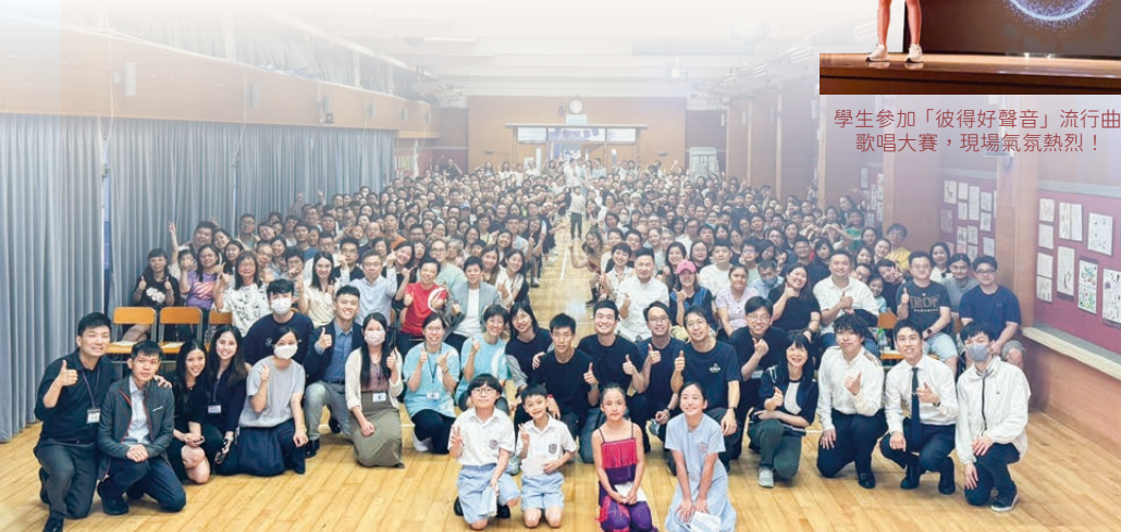
學生參加「彼得好聲音」流行曲歌唱大賽，現場氣氛熱烈！

除了鼓勵學生積極參與課外活動，本校亦會創設各項平台讓學生展示學習成果，包括運動會、水運會、綜藝匯演、「彼得好聲音」流行曲歌唱大賽等，學生皆享受其中。學校亦會鼓勵學生積極參加校內外的比賽、升級或草別考試，從而擴闊學生的視野，發揮最大的潛能。