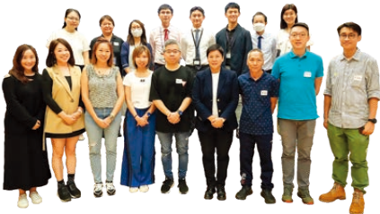
家長教師會第二十四屆執行委員會家長委員及教師委員合照。

家教會每年均舉辦一連串的親子活動，每年的親子旅行和新春團拜參與踴躍，教師、家長、學生均樂在其中。學校不少活動，例如：聖誕聯歡會、運動會、舊校服回收得以順利舉行，實有賴家長委員和家長義工的熱心參與。