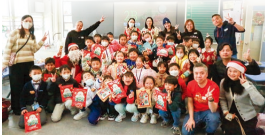
家長教師會委員及家長義工於聖誕聯歡會當天進入每個課室與同學一同慶祝，除了唱歌、玩遊戲，還有送禮物及大抽獎。

本校的家長教師會已成立了二十四年。多年來，家教會促進了家長和學校的溝通與合作，讓家校建立了緊密互信的伙伴關係，攜手培養孩子的學習和成長。