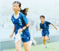
本校創設定向隊，訓練同學的體能、解難能力、團體合作等運動技能。

學校致力推動體育發展，開設足球、排球、手球、籃球、乒乓球、羽毛球、跆拳道、游泳、中國舞、徑項及定向等訓練班。