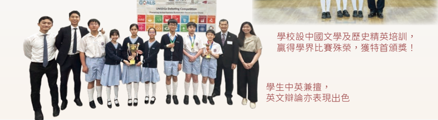
學校設中國文學及歷史精英培訓，贏得學界比賽殊榮，獲特首頒獎！

學校設有中文拔尖班、中國歷史及文學班、中英文辯論隊、英語資優培訓、英語音樂劇、英語會話、閱讀及寫作課程、英語及普通話集誦隊、普通話話劇、奧數校隊培訓、STEAM 拔尖課程及彼得播音員課程等等。