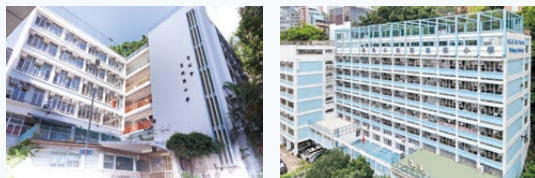
彼得樓校舍 (山道88號)

辦學團體：聖公宗(香港)小學監理委員會 宗教：基督教 創校年份：1884 學校類別：政府資助全日制男女小學 校訓：非以役人，乃役於人 班級結構：每級六班，混合能力編班