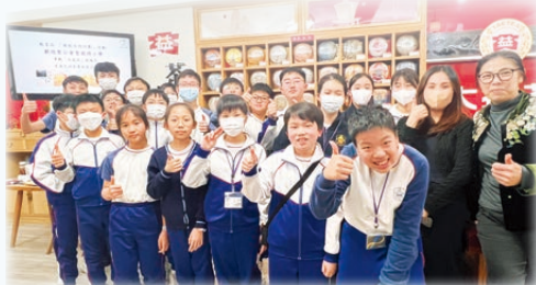
茶道文化源遠流長，值得我們認識、保留與承傳。