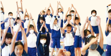
本校舉辦英文瑜伽活動，由校外專業瑜伽導師以英文教授五年級學生瑜伽，藉跨學科體驗活動帶出成長型思維的重要性。

各科組協作舉辦跨課程學習活動，例如英文瑜伽活動、跨課程主題式教學、智能家居專題研習等，讓學生打破知識隔閡，把共通能力轉移，實踐所學。數學科繼續發展建模課程，讓學生應用數學概念解決現實生活難題。