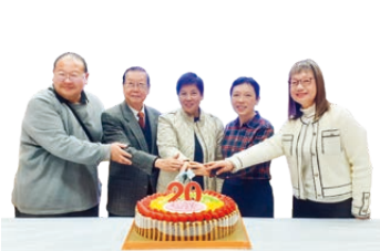
同賀校友會成立 20 周年。

本校具有悠久的歷史和優良的傳統，培育出無數的人才。聖彼得校友會於 2005 年成立，多年來校友透過不同的形式回饋母校，除了設立譚文清、任岫雲老師紀念基金、王曦老師音樂教育紀念基金、體藝獎勵計劃、常識 STEAM 最佳專題研習獎、彼得好聲音獎項、陸運會及水運會傑出運動員獎項外，亦定期舉辦不同類型的活動及擔任學校活動的嘉賓、評判等。