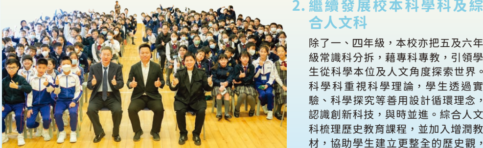
中國科學院徐星院士於2025年2月19日蒞臨本校，為五、六年級學生舉辦主題講座，講題為「尋找恐龍化石的故事」。

中文科和英文科發展口說課程，有系統地教授說話技巧，透過教學活動、演講比賽等，重點訓練學生的演講、即席演講和小組討論等技巧，學習說之以理，動之以情，提升學生的傳意能力、技巧和自信。其他學科亦加入語言和思維技巧教學，讓學生學會說之以理，以理服人。