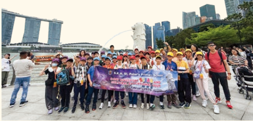
新加坡境外交流團的同學在魚尾獅前留下合影，記錄下大家燦爛的笑容。

同學們亦到訪了新加坡動物園及飛禽公園，了解不同動物的習性以及認識新加坡獨有的動物。本次考察之旅進行了多種與 STEAM 有關的體驗及學習活動，讓同學大開眼界。